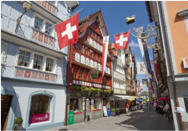
Dorfrundgang und Zeit für Eindrücke

Das Appenzeller Land überrascht uns mit seiner hügeligen und malerischen Landschaft. Im autofreien Appenzell verlocken die schmucken Gassen mit den zahlreichen kleinen Ladengeschäften zum Flanieren und zum Einkaufsbummel. Charakteristisch sind die mit Malereien reich verzierten Häuser und die vielen Arbeiten der Ziseleure. Eine Appenzeller Gürtelschnalle ist ein „must to have“. Aber auch kleinere Dinge wie die Bauernmalereien, Trachtenutensilien oder das Appenzeller Biberli zum Knabbern lassen uns verzaubern.