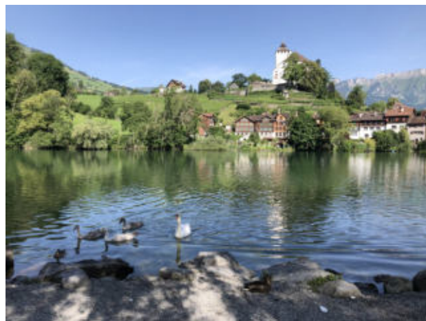
Werdenberg mit Burg und Seeli

Der Tag endet mit dem Besuch der kleinsten Stadt der Schweiz «Werdenberg»